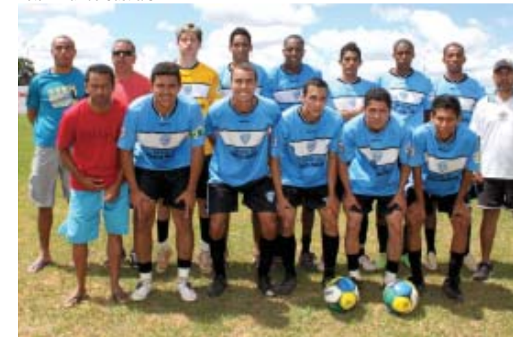
O Maringá mantém uma base de veteranos, aliada à juventude

que pegará a Católica também neste fim de semana.